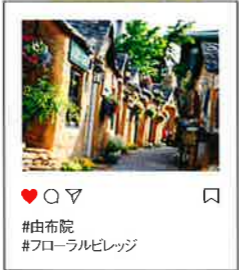
YUFUIN FLORAL VILLAGE 大分県由布市湯布院町川上1503-3