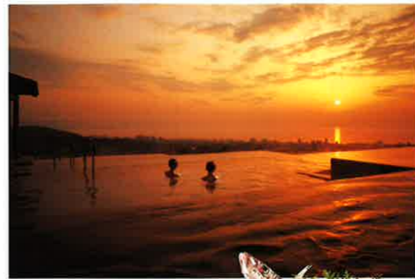
杉乃井ホテル(別府市)