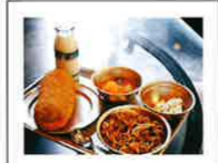
#豊後高田 #給食 #ランチ

映画『ナミヤ雑貨店の奇蹟』のロケ地となった昭和の雰囲気が残る商店街はもちろん、真玉海岸や長崎鼻など「インスタ映え」する話題のロケ地が盛りだくさん! 花いろ温泉、真玉温泉 ほか