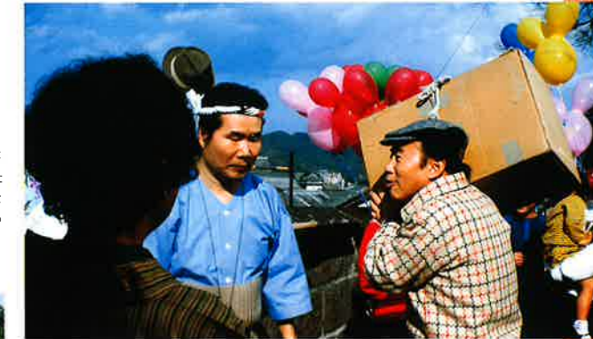
「男はつらいよ 花も嵐も寅次郎」 監督/山田洋次(1982年)