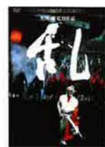
映画『乱』 デジタル・リマスター版』 発売・販売元： 株式会社KADOKAWA 価格：DVD 3,024円(税込) / 発売中