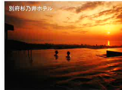
別府杉乃井ホテル

別府八湯と呼ばれる様々な泉質の温泉が点在し、市内の至る所から常に湯めぐりが立ち上る景色は壮観。露天風呂に浸かりながら別府湾を一望できる杉乃井ホテルの欄干も要チェック。 別府八湯(鉄輪温泉、観海寺温泉 ほか)