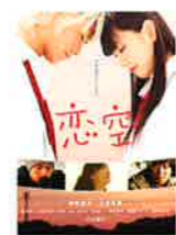
映画『恋空』 スタンダード・エディション』 発売元：TBS 販売元：東宝 価格：DVD 4,104円(税込) / 発売中