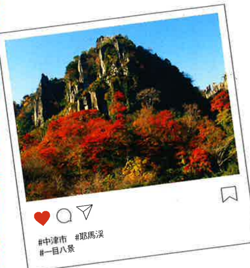
中津市 #耶馬溪 #一目八景